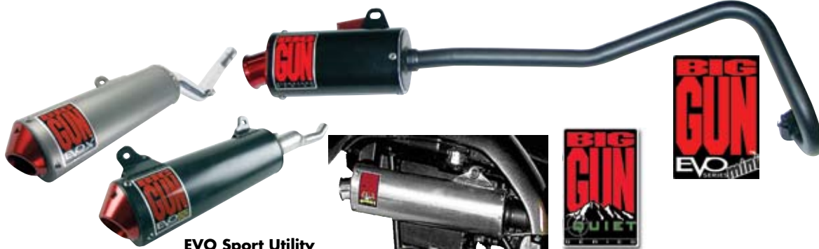
EVO Sport Utility